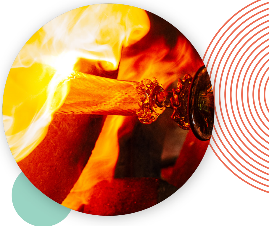
Proceso de fabricación de la copa Soraya . Gordiola

Director. Glas - Museo de Arte en Vidrio (Ebeltoft, Dinamarca)